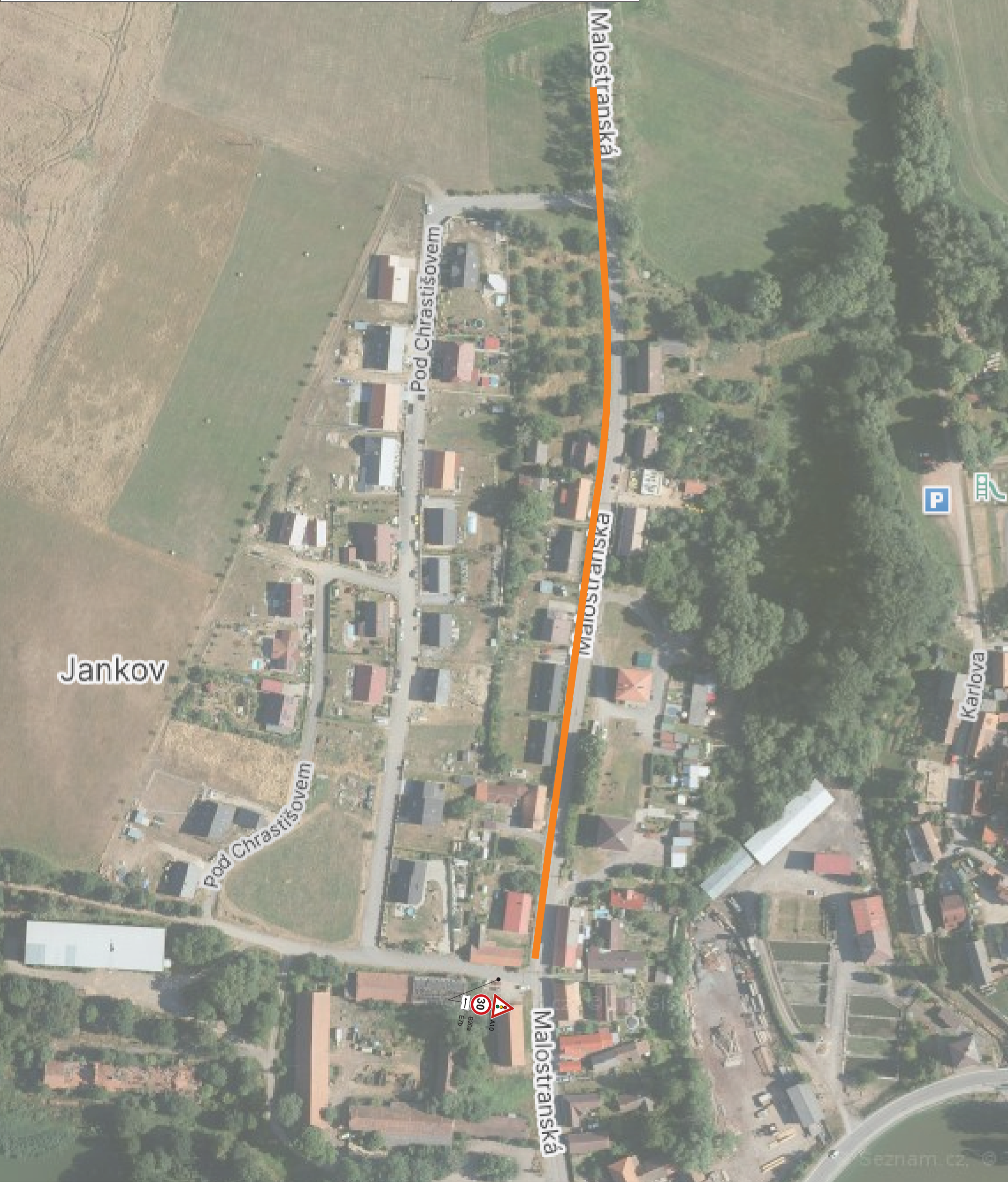
Detail pracovního místa - dle upraveného schéma B/6 bude realizováno dle vyznačených úseků.